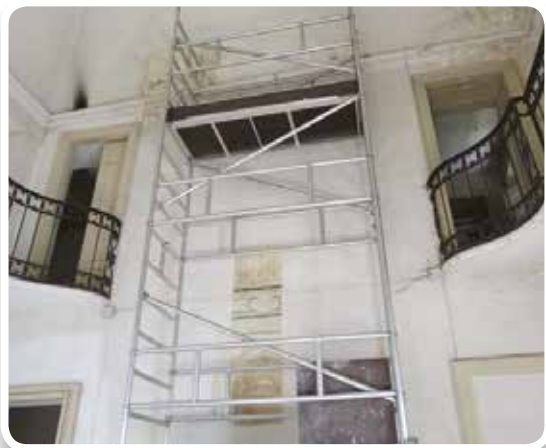
La ringhiera del salone al primo piano, con l'affresco di "congiunzione"

Per quanto riguarda la manutenzione asfalti, sono stati individuati alcuni interventi necessari ed urgenti ed è stato stilato un primo lotto