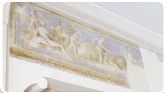
L'affresco già emerso al piano terra